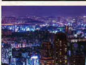
韓国周辺スーベリア