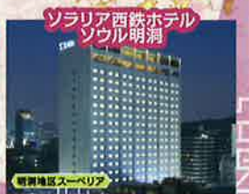
韓国周辺スーベリア