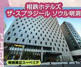
韓国周辺スーベリア