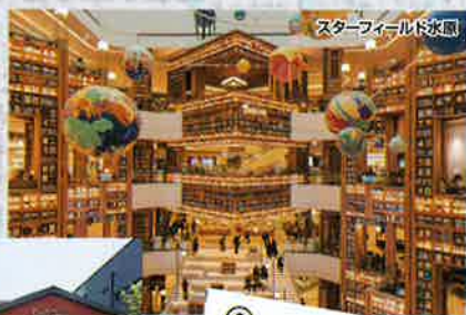
スターフィールド水原