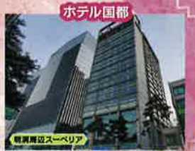
韓国周辺スーベリア